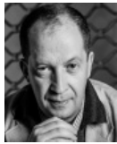
Michel Taube Directeur de la publication