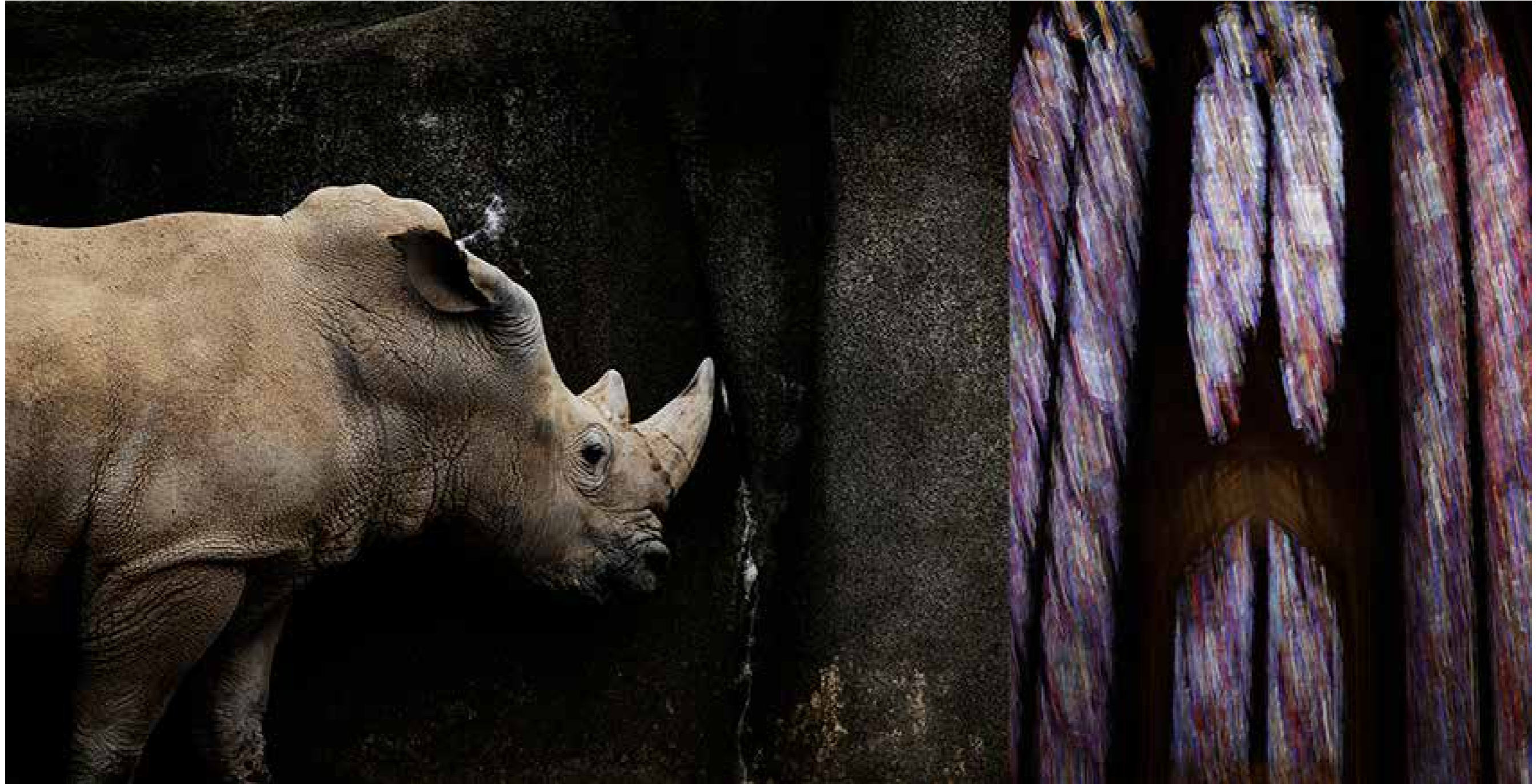
© the keeper by Jennifer Westjohn