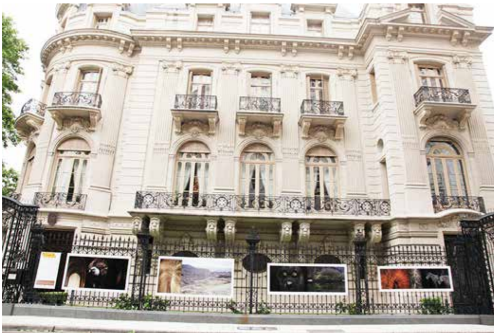
. French Embassy, Buenos Aires Argentina.