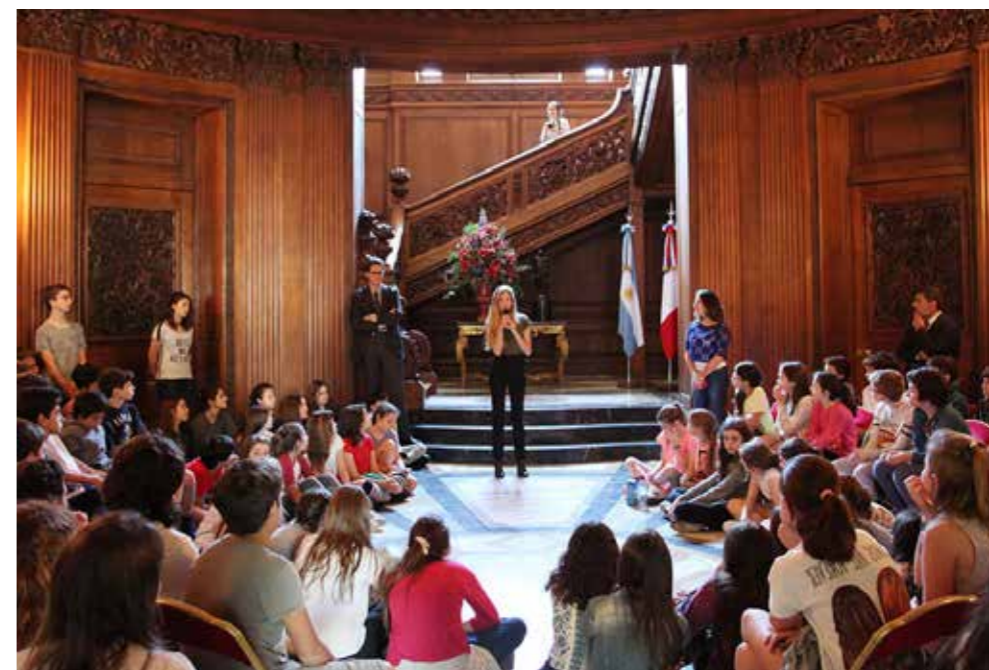
. Conference at the French Embassy, Buenos Aires, Argentina.